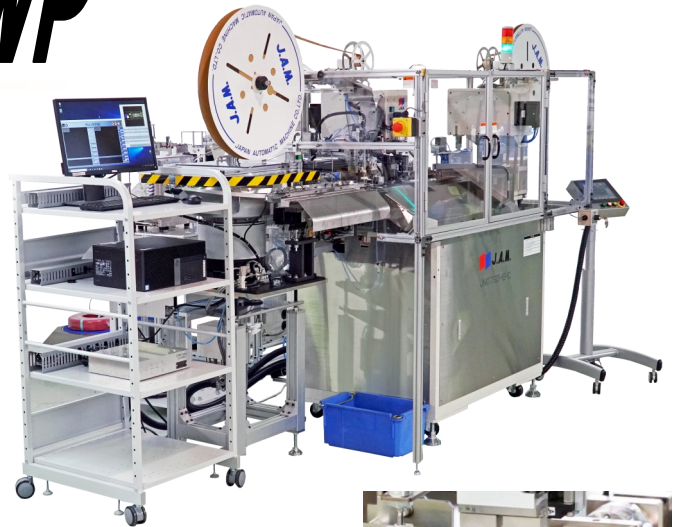
防水シール挿入 Seal insertion